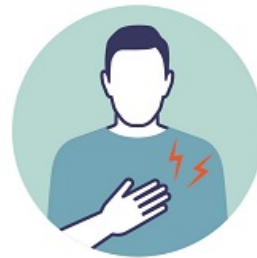
БОЛЬ В МЫШЦАХ