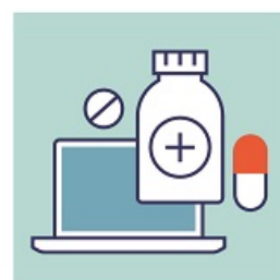
НЕ ЗАНИМАЙТЕСЬ САМОЛЕЧЕНИЕМ